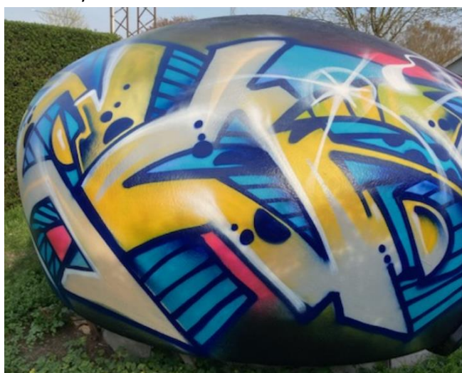
De udsmykkede busskure

GU – Grøntudvalget Fredensbjergparken Inger-J23 / Stig-S19 / Morten-K23 / Rikke-J64 / Steen-S7